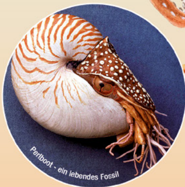
Perlboot - ein lebendes Fossil

Weltweit schwimmen über 700 verschiedene Arten von Kopffüßern durch die Meere. Einige Arten davon leben auch in Ost- und Nordsee.